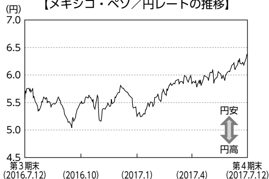
【メキシコ・ペソ/円レートの推移】