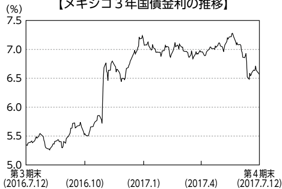
【メキシコ3年国債金利の推移】