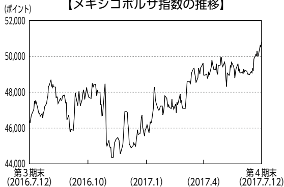
【メキシコボルサ指数の推移】