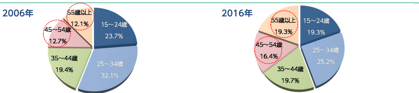
図表1：管理職や専門性の高い人材を求める動きから45歳以上の中高年層の転職が活発になっている

出所：総務省「労働力調査」を基にニッセイアセットマネジメントが作成 ※転職者の年齢別構成