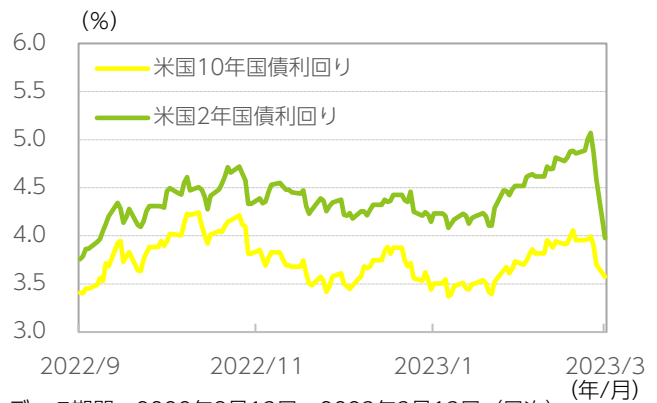
図表1：金融引き締め姿勢への転換で金利は上昇

データ期間：2022年9月13日～2023年3月13日 (日次) ※米国の長期・短期金利の推移