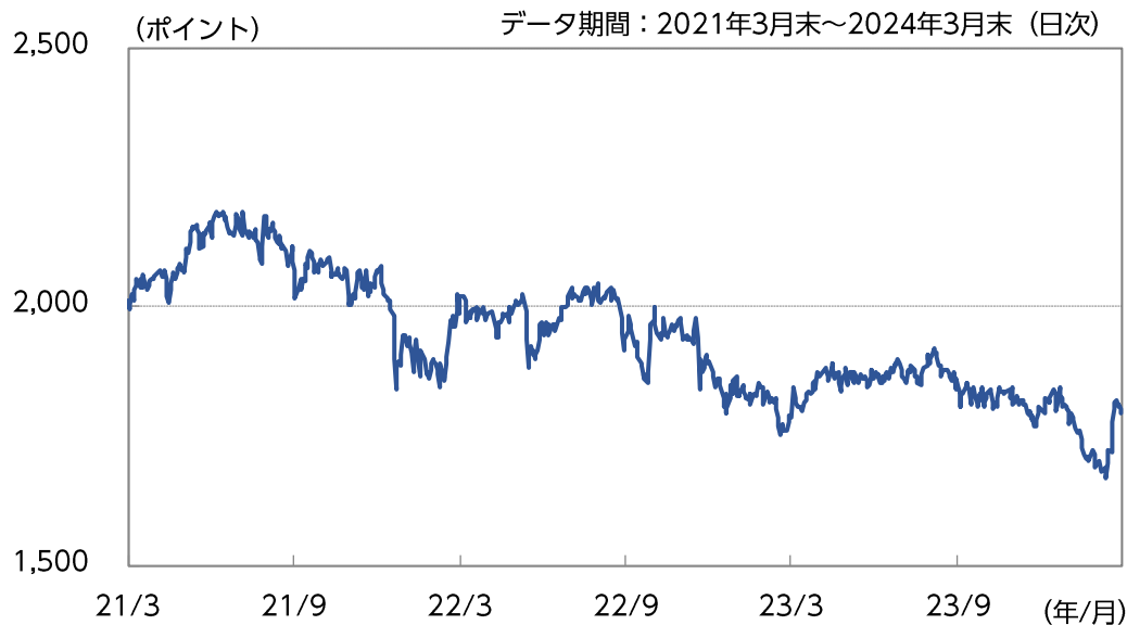
【東証REIT指数(配当除き)の推移】