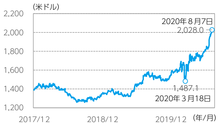
図表1：金先物価格の上昇が続く

データ期間：2017年12月29日～2020年8月7日（日次） ※ニューヨーク金先物価格（中心限12月物）の推移