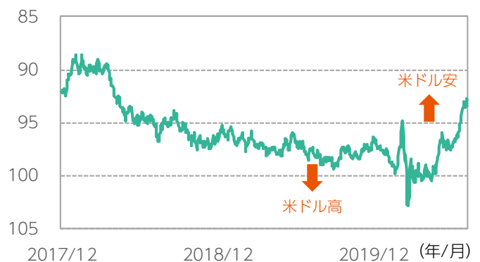
図表3：足元では主要通貨に対し米ドル安傾向

データ期間：2017年12月29日～2020年8月7日（日次） ※米ドルインデックス（ユーロ・円・ポンドなど複数の主要国通貨に対する米ドルの価値を指数化したもの）の推移（逆目盛り）