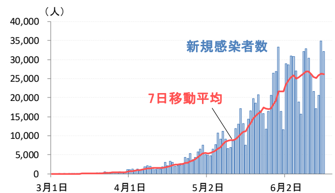
図表2：ブラジルの新型コロナウイルス新規感染者数*