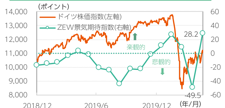
※ドイツDAX指数とZEW景気期待指数の推移 データ期間：2018年12月31日～2020年5月21日(日次) *ZEW景気期待指数は月次データ