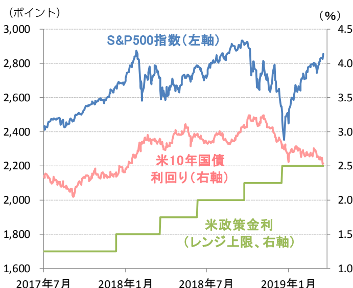
図2：米国株、米政策金利、米長期金利の推移

(期間) 2017年7月3日～2019年3月21日 (日次)