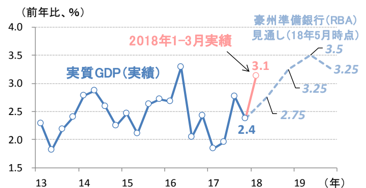
図3：豪州の実質GDP成長率の実績とRBA予想