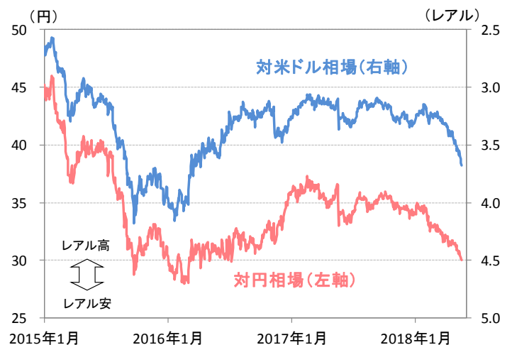
図2：ブラジル・レアルの対米ドル、対円相場

(期間) 政策金利：2016年1月1日～2018年5月16日 拡大消費者物価指数 (IPCA)：2016年1月～2018年4月 (注) ブラジル中銀のインフレ見通し(市場シナリオ)は、政策金利と為替レートの予想前提に市場コンセンサスを使用したもの。政策金利の市場コンセンサスは2019年6月末まで。