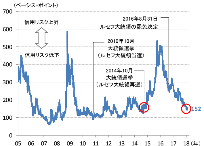
図2：ブラジル国債のCDSスプレッド（5年物、米ドル建て）

(出所) ブルームバーグ（期間）2005年1月3日～2018年2月7日 (注) CDS（クレジット・デフォルト・スワップ）スプレッドは国債の債務不履行リスクに対する信用保証料。