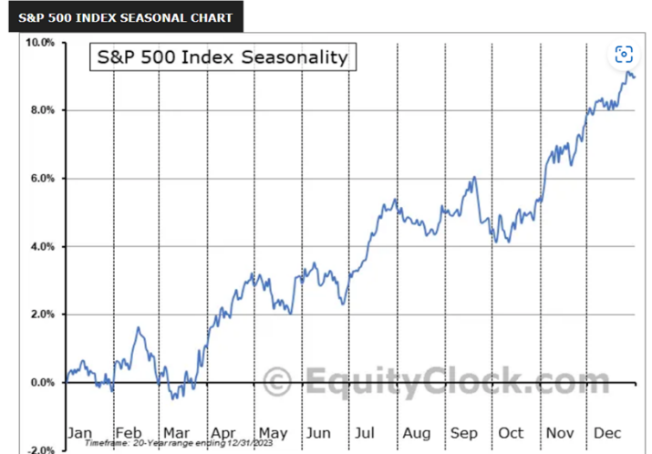
<② S&P500の季節性 (過去20年間の日次平均) 3月は調整>